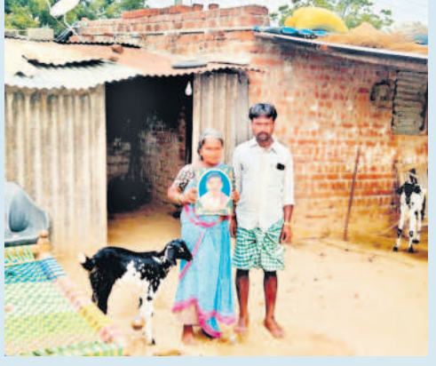
బిచ్చ పాటితో భార్య కోటి, కుమారుడు కోటుయ్య

ఉమ్మడి జిల్లాలో ఒక్క కరెంటు కాటుకు 142 మంది బలి పాముకాట్ల దావులకు లెక్కలేదు ఇప్పటి పరిస్థితి ఉంటే తమవాళ్లు బతికి ఉంటుంటే అంటున్న కుటుంబాలు వ్యవసాయరంగ ప్రగతిని మార్చిన ఉచిత కరెంటు కరువును దూరం చేసిన విప్లవాత్మక మార్పు కాంగ్రెస్ పాలనలో రైతు'బ'.. టీఆర్ఎస్ పాలనలో బాహుబలి