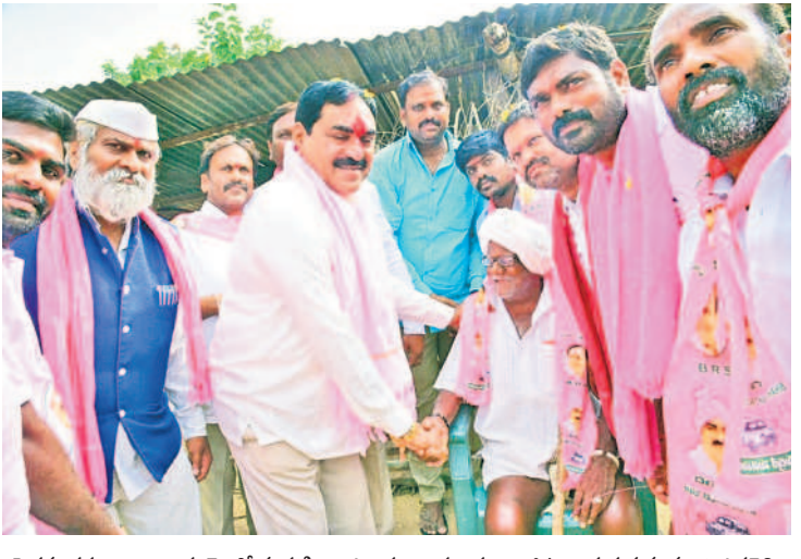
పెద్దవంగల్ : కాన్వాయిగూడెంలో వృద్ధుడిని ఆహ్వానంగా పలుకరించి ఓటు అడుగుతున్న మంత్రి ఎర్రబెల్లి