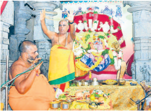
యాదగిరిగుట్టలో స్వామి, అమ్మవార్ల నిత్య తిరుకల్యాణం నిర్వహిస్తున్న ఆర్చకులు

యాదగిరిగుట్ట, నవంబర్ 4 : యాదగిరిగుట్ట ప్రధానాలయ ముఖ మండపంలో లక్ష్మీనరసింహస్వామి దర్బార్ సేవోత్సవం అత్యంత వైభవంగా సాగింది. శనివారం సాయంత్రం స్వామి, అమ్మవార్లకు పారాయణం చేశారు. అనంతరం స్వామివారికి నక్షత్ర హారతి ఇచ్చి భక్తులకు అనుమతినిచ్చారు. స్వామి, అమ్మవార్లకు నిత్యోత్సవాలు శాస్త్రోక్తంగా జరిగాయి. గురువారం తెల్లవారుజామున ఆలయాన్ని తెరిచిన ఆర్చకులు సుప్రభాతంతో స్వామివారిని మేల్కొల్పారు. అనంతరం తిరువారాధన జరిపి ఉదయం ఆరగింపు చేపట్టారు. ప్రధానాలయంలో స్వామి, అమ్మవార్లకు నిజాబీషికం చేశారు. నిజరూప దర్శనంలో నారసింహులు భక్తులకు దర్శనమిచ్చారు. స్వామివారికి తులసీ సహస్రనామార్చన, అమ్మవారికి కుంకుమార్చన, ఆంజనేయస్వామికి సహస్రనామార్చన చేపట్టి భక్తులకు స్వామి, అమ్మవార్ల దర్శన భాగ్యం కల్పించారు. ప్రధానాలయ మొదటి ప్రాకార మండపంలో సుదర్శన నారసింహ హోమం జరిపిన అనంతరం స్వామి, అమ్మవార్లను దివ్యమనో