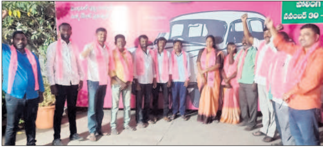
మహాముత్తారం : బీఆర్ఎస్ లో చేరిన వారితో మున్సిపల్ చైర్మన్ పుట్ట శైలజ