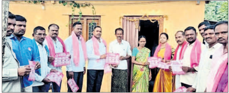
ముత్తారం: ప్రచారం చేస్తున్న బీఆర్ఎస్ నాయకులు