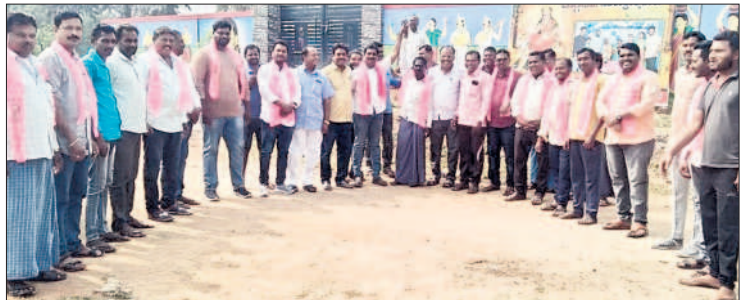
రామగిరి : బేగంపేటలో ప్రచారం చేస్తున్న బీఆర్ఎస్ నేతలు