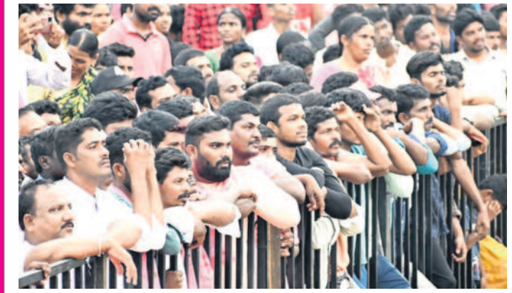
కేసీఆర్ ప్రసంగాన్ని ఆసక్తిగా వింటున్న ప్రజలు