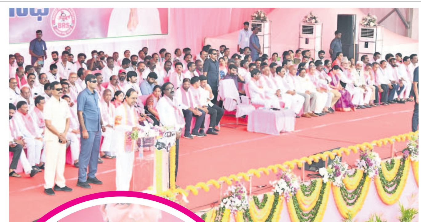
ఖమ్మం ప్రజా ఆశీర్వాద సభలో మాట్లాడుతున్న సీఎం కేసీఆర్ వేదికపై ఎంపీలు, ఎమ్మెల్యేలు, ఎమ్మెల్యే, బీఆర్ఎస్ అభ్యర్థులు, ఇతర ప్రజా ప్రతినిధులు