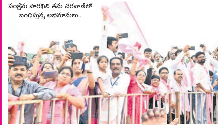
సంక్షేమ సారథిని తమ చరచాణిలో బంధిస్తున్న అభిమానులు..