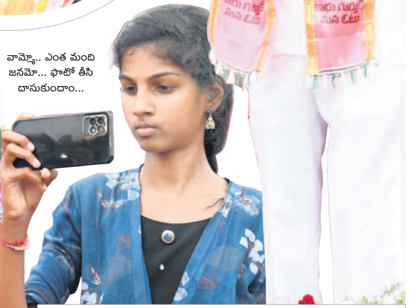
వామ్మో.. ఎంత మంది జనమో... ఫోటో తీసి దాసుకుందాం...