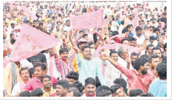
ప్రగతి రథసారథిని చూసిన ఆనందంలో యువత కేరింతులు..