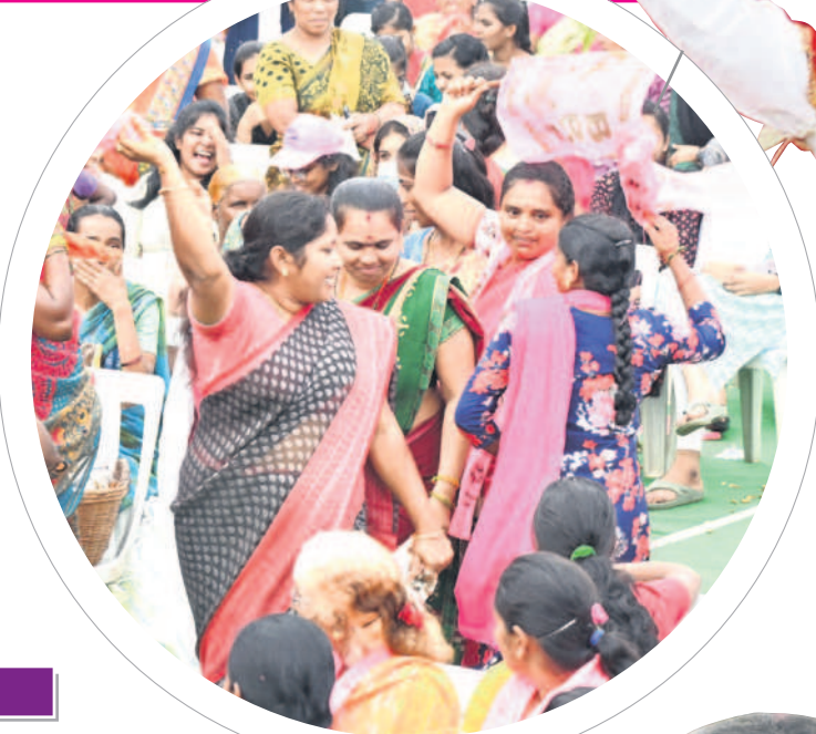
జజ్జనకరి జనారే.. మళ్లీ సీఎం కేసీఆర్.. అంటూ మహిళల నృత్యం