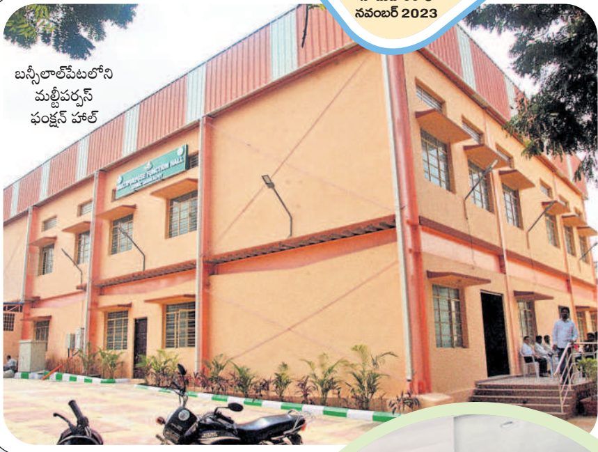
బస్టిలాల్పేటలోని మల్టీపర్పస్ ఫంక్షన్ హాల్

హైదరాబాద్ నగరంలో సామాన్యులు పెళ్లి, ఇతర వేడుకలు చేయడమంటే సులువు కాదు.. ఖర్చు తడిసి మోపడపుతున్నది. ఇంటి వద్ద దాచికి చేద్దామంటే ఉన్న వీధులు ఇరుక్కా ఉంటాయి. ఏదైనా ఫంక్షన్ హాల్ బుక్ చేద్దామంటే తక్కువలో తక్కువ రూ. 80 వేల నుంచి లక్ష రూపాయల వరకు ఉంటుంది. వంట సామగ్రి, డెకరేషన్, ఇతరత్రా కలిపి మరో రూ. 50వేలు దాటుతుంది. ఈ నేపథ్యంలోనే ఫంక్షన్ హాళ్ల అద్దెలు భరించలేని మధ్య, దిగువ తర గతి, సామాన్య ప్రజలకు అందుబాటులో ఉండేలా చర్యలు చేపట్టాలని పురపాలక శాఖ మంత్రి కేటీఆర్ జీహెచ్ఎంసీని ఆదేశించారు. ఈ నేపథ్యంలో రూ. 90 కోట్లతో 31 చోట్ల మల్టీపర్పస్ ఫంక్షన్ హాళ్లు నిర్మించాలని భావించి ఈ మేరకు విడతల వారీగా పనులకు శ్రీకారం చుట్టారు. ఇందులో భాగంగానే ఇప్పటి వరకు రూ. 30.10కోట్లతో తొమ్మిది చోట్ల మల్టీపర్పస్ ఫంక్షన్ హాళ్లను అందుబాటులోకి తీసుకొచ్చారు. అందుబాటులోకి వచ్చిన బహుళ వినియోగ ఫంక్షన్ హాళ్ల వందలాది మందికి ఎంతో ప్రయోజనం చేకూరుతున్నాయి. ఈ క్రమంలోనే జీహెచ్ఎంసీ రూ. 64.98 కోట్లతో మరో 15 చోట్ల మల్టీపర్పస్ ఫంక్షన్ హాళ్లను శ్రీకారం చుట్టగా, విడతల వారీగా వీటిని అందుబాటులోకి తీసుకొస్తున్నారు.