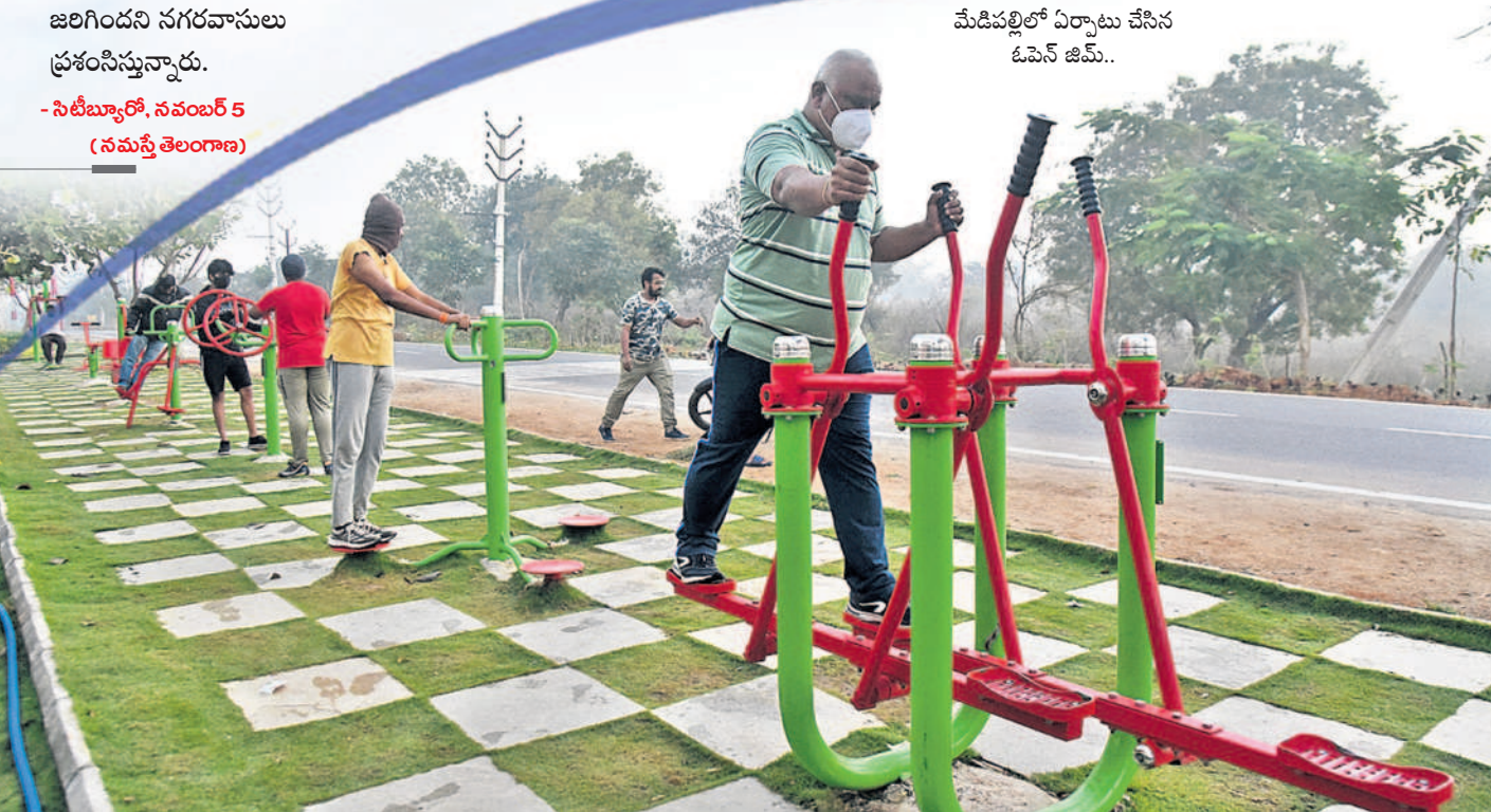
మేడిపల్లిలో ఏర్పాటు చేసిన ఓపెన్ జిమ్..

ఆరోగ్యాన్నిచ్చే ఓపెన్ జిమ్లు.. నగరవాసులు ఆరోగ్యాన్ని కాపాడుకునేలా జీహెచ్ఎంసీ ఓపెన్ జిమ్లకు అత్యధునిక ప్రాధాన్యం ఇస్తున్నది. నెలకు వేలల్లో ఫీజులు చెల్లించి దేశాదారాధ్యాన్ని మలుచుకునే పరిస్థితికి దూరంగా ఒక్క రూపాయి ఖర్చు లేకుండా బిల్డియా ముఖ్యమైన పార్కుల్లో ఓపెన్ జిమ్లను అందుబాటులోకి తీసుకొచ్చింది. వివిధ క్రీడాస్థానాల్లో హాళ్లు, సెక్టర్లను సమగ్రంగా 135 ఆధునిక జిమ్లు/ఫిట్నెస్ కేంద్రాలు ఉండగా, బహిరంగ ప్రదేశాల్లో 135 చోట్ల ఓపెన్ జిమ్లను ఏర్పాటు చేశారు. జోనల్ స్థాయిలో వీటి నిర్వహణ జరుగుతున్నది. ప్రజల డిమాండ్కు అనుగుణంగా ఆధునిక జిమ్లు, ఓపెన్ జిమ్లను అందుబాటులోకి తీసుకొస్తున్నారు. ఇప్పటివరకు జీహెచ్ఎంసీ పరిధిలో 270 జిమ్ సెంటర్లు ఉన్నాయని, రాబోయే రోజుల్లో వీటి సంఖ్యను మరింత పెంచనున్నట్లు అధికారులు పేర్కొన్నారు.