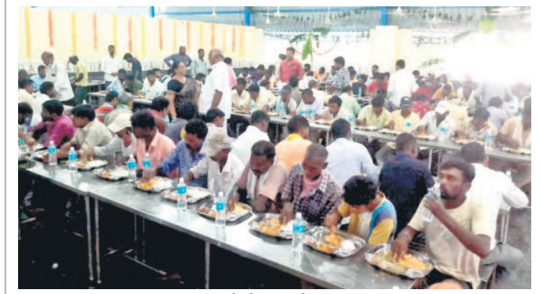
నత్తంలో భోజనాలు చేస్తున్న ప్రజలు