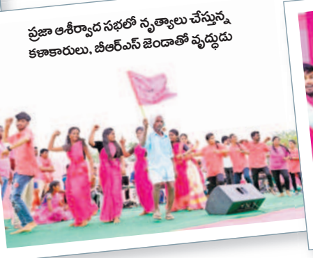
ప్రజా ఆశీర్వాద సభలో నృత్యాలు చేస్తున్న కళాకారులు, బీఆర్ఎస్ జెండాతో వృద్ధుడు