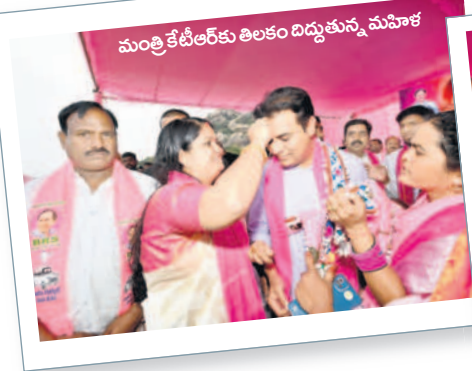
మంత్రి కేటీఆర్ కు తిలకం దిద్దుతున్న మహిళ

నుంచి ప్రధాని, హోంమంత్రి, కేంద్ర మంత్రులు ప్రచారానికి వస్తున్నారని ఎద్దేవా చేశారు. తెలంగాణలో బీజేపీ ఫైల్ ఖతం దుకాణం బండ్ అయ్యిందని మంత్రి దుయ్యబట్టారు. బీఆర్ఎస్ సర్కారు తొమ్మిదిన్నరేండ్ల పాలనలో అన్నివర్గాల ప్రజలకు మేలు చేశారని అన్నారు. తండాలును ప్రత్యేక గ్రామ పంచాయితీలుగా ఏర్పాటు చేసి వారి తండాలో వారికే పాలన అప్పగించామన్నారు. గిరిజన రిజర్వేషన్లు 6 నుంచి 10 శాతానికి పెంచామని గుర్తుచేశారు. తెలంగాణలో అమలు చేస్తున్న ఏ ఒక్క పథకమైనా కాంగ్రెస్, బీజేపీ పాలనలో అమలు చేస్తున్నారా అని ప్రశ్నించారు. ప్రజలు విజ్ఞతతో ఆలోచించి ఓట్లు వేయాలని, అనాలోచిత నిర్ణయాలు తీసుకుంటే భవిష్యత్ అంధకారం అవుతుందని హెచ్చరించారు. జైపాల్ యాదవ్ ను భారీ మెజాస్టీతో గెలిపిస్తే ఆమనగల్లుకు రెవెన్యూ డివిజన్, ఎంపీబి కార్యాలయం, డిఎస్సీ కార్యాలయంతోపాటు, గట్టుపల్లపల్లి, వెల్లూర్, రఘుపతిపేట మండలాలను ఏర్పాటు చేస్తామని మంత్రి కేటీఆర్ హామీ ఇచ్చారు. అంతకుముందు కేటీఆర్ కు బీఆర్ఎస్ నేతలు గద, గొంగడి, గొర్రెపిల్లను బహుకరించారు. మాజీ మంత్రి, బీఆర్ఎస్ నేత నాగం జనార్దన్ రెడ్డి మాట్లాడుతూ డబ్బు మూటలతో వచ్చిన కాంగ్రెస్ నాయకులను నమ్మవద్దని సూచించారు. ఎమ్మెల్యే జైపాల్ యాదవ్ మాట్లాడుతూ కాంగ్రెస్ పార్టీకి చెందిన అభ్యర్థి సంతలో పశువులను కొన్నట్లు బీఆర్ఎస్ నాయకులను కొనుగోలు చేస్తున్నారని మండిపడ్డారు. కార్యక్రమంలో జెడ్పీటీసీలు అనురాధ, దశరథ్ నాయక్, విజితారెడ్డి, డి.సీ.బి డైరెక్టర్ వెంకటేశ్, ఎంపీపీలు నిర్మల, మనోరమ, ఏఎంసీ చైర్మన్ శ్రీనివాస్ రెడ్డి, వైస్ చైర్మన్ తోట గిరియాదవ్, వైస్ ఎంపీపీలు అనంతరెడ్డి ఆనంద్, మండలాల, పట్టణాల అధ్యక్షులు అర్జున్ రావు, పత్మానాయక్, పరమేశ్ పాల్గొన్నారు.