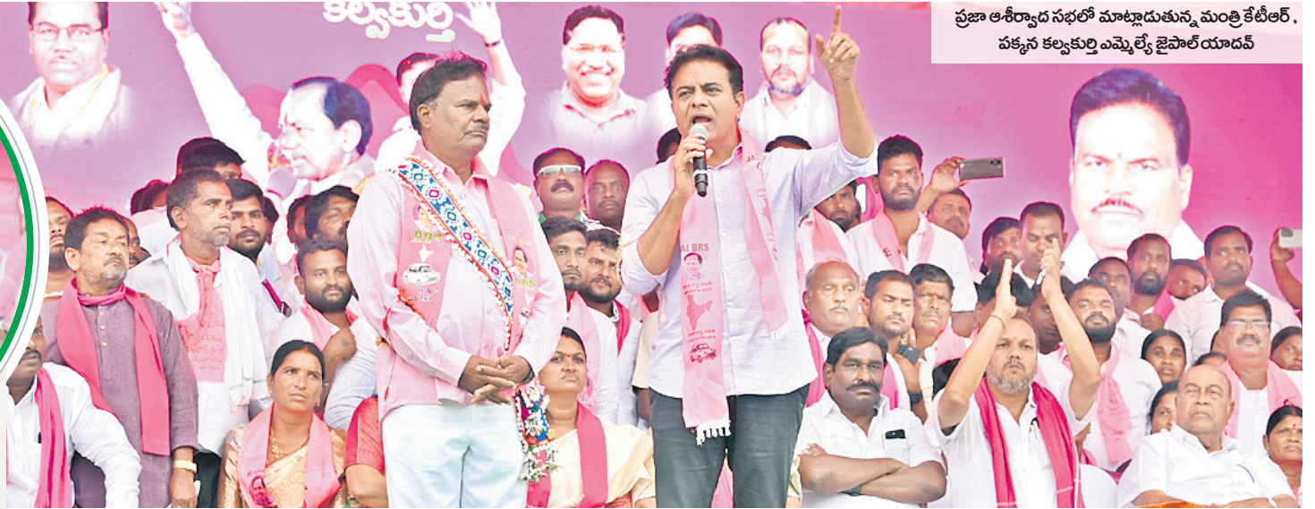
ప్రజా ఆశీర్వాద సభలో మాట్లాడుతున్న మంత్రి కేటీఆర్. పక్కన కల్వకుర్తి ఎమ్మెల్యే జైపాల్ యాదవ్