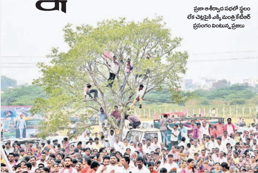
ప్రజా ఆశీర్వాద సభలో స్థలం లేక చెట్లపైకి ఎక్కి మంత్రి కేటీఆర్ ప్రసంగం వింటున్న ప్రజలు

రాష్ట్రం ఏర్పాట్లో తొమ్మిదిన్నర సంవత్సరాలు కావస్తున్నదని, ముఖ్యమంత్రి కేసీఆర్ పాలనలో రాష్ట్రం అన్ని రంగాల్లో అగ్రగామిగా నిలిచిందన్నారు. రైతులకు 24 గంటల ఉచిత విద్యుత్, రైతుబంధు, రైతుబీమా, కల్పాణలక్ష్మి, పింఛన్లు ఇలా ఎన్నో సంక్షేమ పథకాలను అమలు చేస్తూనే.. సాగునీటి రంగంలో విస్తృత విప్లవాన్ని తీసుకొచ్చామని చెప్పారు. దేశంలోనే తెలంగాణ రాష్ట్రం అభివృద్ధిలో అగ్రగామిగా నిలిచిందని వివరించారు. కాంగ్రెస్ పార్టీపై ఫైర్ సభలో మంత్రి కేటీఆర్ కాంగ్రెస్ పార్టీపై నిప్పులు చెరిగారు. పక్క రాష్ట్రాల నుంచి నాయకులను అరుపు తెచ్చుకొని ప్రచారం నిర్వహిస్తున్న మీరు నాయకులైనా అంటూ మండిపడ్డారు. డబ్బు సంపాదనతో ప్రజలను వంచనకు గురిచేస్తున్నారని దుయ్యబట్టారు. కర్ణాటక రాష్ట్రం నుంచి అరుపు తెచ్చుకున్న మీ పార్టీ నాయకుడు, కర్ణాటక ఉప ముఖ్యమంత్రి శివకుమార్ మాట్లాడిన మాటలతో తెలంగాణ బిడ్డలు నవ్వుతున్నారని ఎద్దేవా చేశారు. కర్ణాటకలో 5 గంటల కరెంటు ఇస్తున్నామని, తెలంగాణలో కూడా 5 గంటల కరెంటు ఇస్తామని చెప్పడం సిగ్గుబేసి, కాంగ్రెస్ నాయకుల తీరును ప్రజలు అసహ్యించుకుంటున్నారన్నారు.