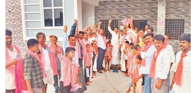
మరికల్ మండలంలో ప్రచారం చేస్తున్న బీఆర్ఎస్ నాయకులు