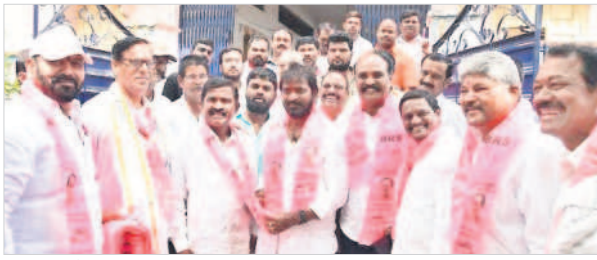
మంత్రి శ్రీనివాస్ గౌడ్ సమక్షంలో బీఆర్ఎస్ లో చేరుతున్న హన్మండ్ల మండల నాయకులు