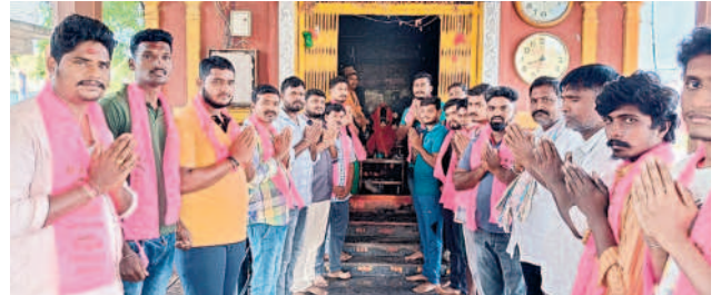
ఆలయంలో పూజలు చేస్తున్న యూత్ నాయకులు