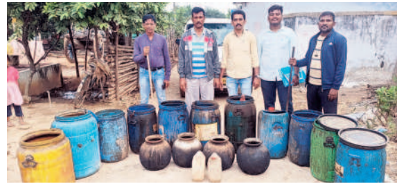
స్వాధీనం చేసుకున్న డ్రమ్ములను చూపుతున్న ఎక్సైజ్ అధికారులు