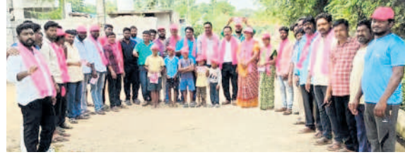
ఎన్నికల ప్రచారం నిర్వహిస్తున్న బీఆర్ఎస్ నాయకులు