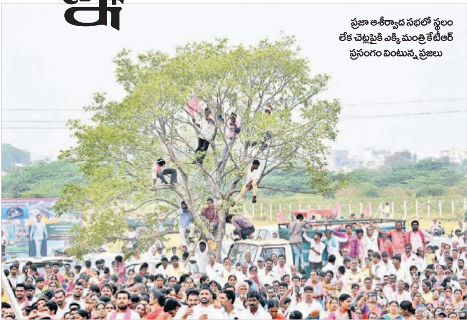
ప్రజా ఆశీర్వాద సభలో స్థలం లేక చెట్లపైకి ఎక్కి మంత్రి కేటీఆర్ ప్రసంగం వింటున్న ప్రజలు