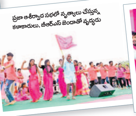
ప్రజా ఆశీర్వాద సభలో నృత్యాలు చేస్తున్న కళాకారులు, బీఆర్ఎస్ జెండాతో వృద్ధుడు