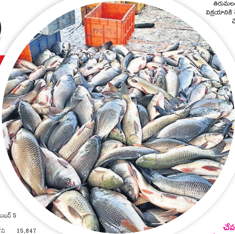
తిరుమలగిరిలో విక్రయానికి తెచ్చిన చేపలు.