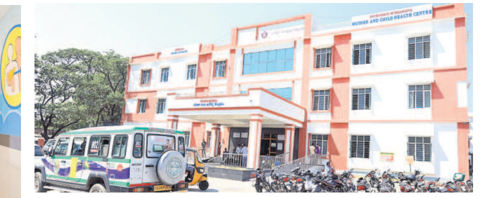
పెద్దపల్లిలోని మాతా శిశు ఆరోగ్య కేంద్రం