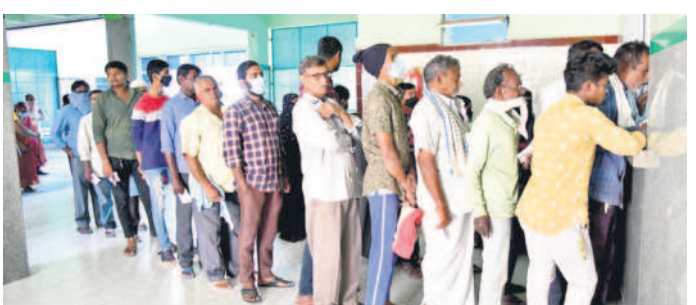
కరీంనగర్ ప్రభుత్వ దవాఖానలో క్యూలో ఉన్న రోగులు