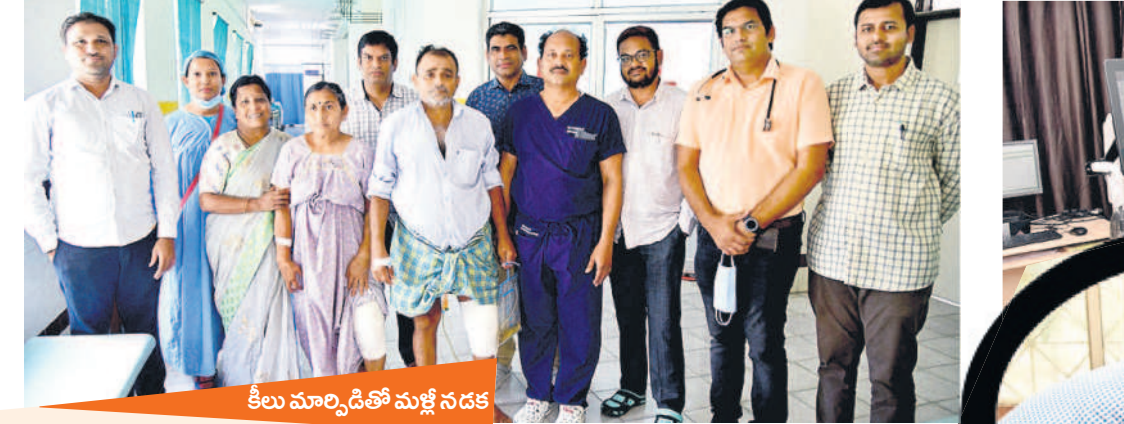
కీలు మార్పిడితో మళ్లీ సడక

పెద్దపల్లి, నవంబర్ 5 (నమస్తే తెలంగాణ)-ప్రత్యేక తెలంగాణ సాధించుకున్న తర్వాత రాష్ట్ర ప్రభుత్వం వైద్య రంగానికి పెద్ద పీట వేసింది. రోగాల బారిన పడి వైద్యం కోసం రూ.లక్షలు ఖర్చు చేస్తున్న ఈ పరిస్థితుల్లో రాష్ట్ర ప్రభుత్వం పేదల కోసం సర్కారు దవాఖానలను అరుదైన శస్త్ర చికిత్సలకు నిలయంగా మార్చింది. ఒకప్పుడు ప్రభుత్వ దవాఖానలకు వెళ్లాలంటే ఇంత జనం ఇప్పుడు ఇక్కడే శస్త్ర చికిత్సలు చేయించుకుంటామనే పరిస్థితికి వచ్చారు. పేదల మున్నగు పొందుతున్న ప్రభుత్వ వైద్యులు ఇప్పుడు ప్రతి దవాఖానలో శస్త్ర చికిత్సలు నిర్వహిస్తూ అరుదైన సేవలు అందిస్తున్నారు. అందులో భాగంగా ఉమ్మడి కరీంనగర్ జిల్లాలోని ప్రభుత్వ ప్రధాన దవాఖానలో ముక్కు, చెవి, గొంతు విభాగం, గైనకాలజీ, గ్యాస్ట్రో ఎంట్రాలజీ, జనరల్ సర్జన్, ప్లాస్టిక్ సర్జరీ శస్త్ర చికిత్సలను విజయవంతంగా నిర్వహిస్తున్నారు. రాష్ట్ర స్థాయిలో ప్రత్యేకంగా నోడల్ ఆధిపాని నియమించి ఈ శస్త్ర చికిత్సలను పర్యవేక్షణ చేస్తున్నారు. దీంతో ప్రతి ప్రభుత్వ దవాఖానలో శస్త్ర చికిత్సలు పెరిగాయి. అంతే కాకుండా.. తుంటి, మోకాలు మార్పిడి వంటి అరుదైన శస్త్ర చికిత్సలు చేస్తూ ప్రభుత్వ దవాఖానలు పేదలకు వరంగా మారాయి.