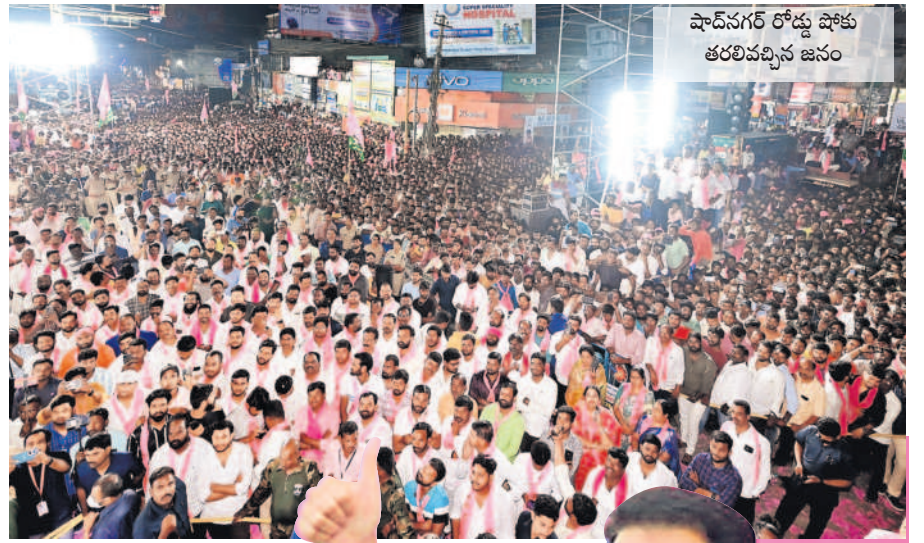
షాద్ నగర్ రోడ్డు షోకు తరలివచ్చిన జనం