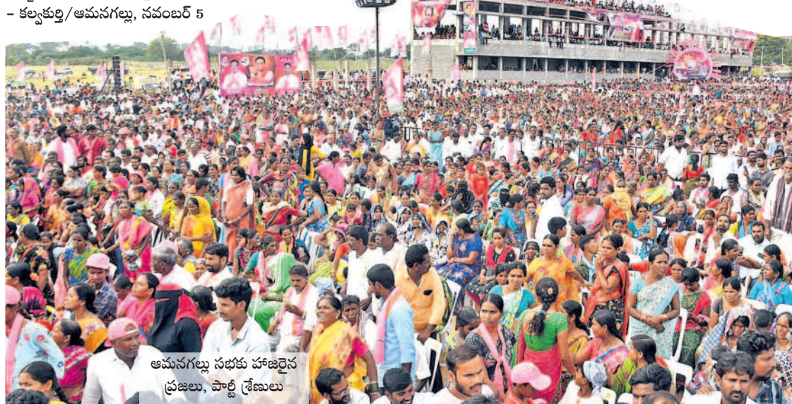
ఆమనగల్గు సభకు హాజరైన ప్రజలు, పార్టీ శ్రేణులు