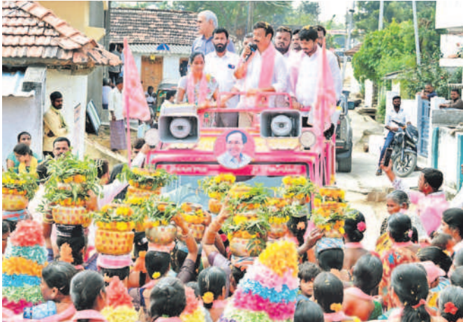
దుబ్బాక నియోజకవర్గం డౌల్టాబాద్ మండలంలో ఎన్నికల ప్రచారంలో మాట్లాడుతున్న మెదక్ ఎంపీ కొత్త ప్రభాకర్‌రెడ్డి (పైల్)