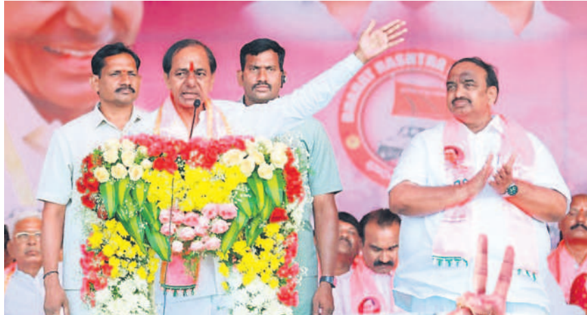
హుస్సాబాద్‌లో ప్రజాఆశీర్వాద సభలో మాట్లాడుతున్న సీఎం కేసీఆర్ (పైల్)