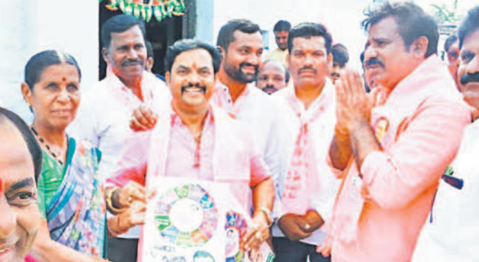
అదివారం మునిపల్లి మండలం చిన్నచెయ్యెడ ప్రచారంలో ఎమ్మెల్యే క్రాంతికిరణ్