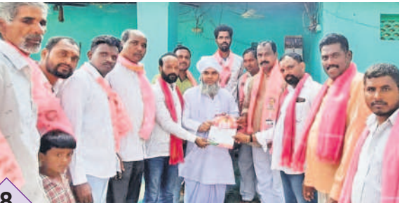
అనంతసాగర్ లో ఇంటింటి ప్రచారం చేస్తున్న బీఆర్ఎస్ శ్రేణులు