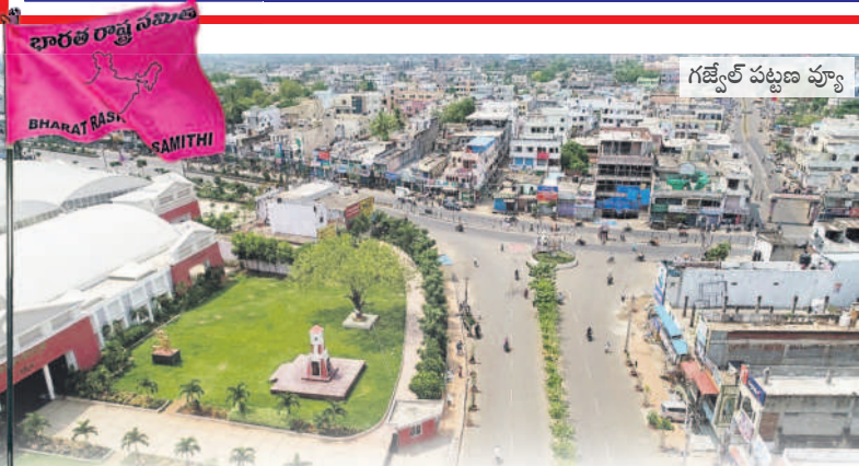
గజ్వేల్ పట్టణ వూర్లు