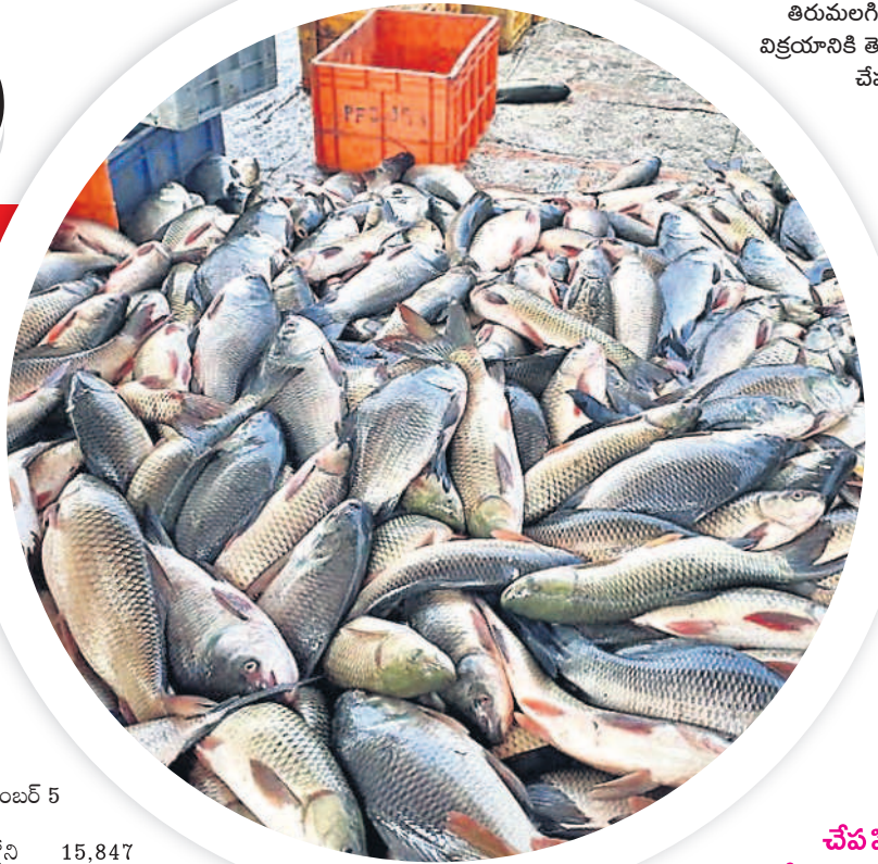
తిరుమలగిరిలో విక్రయానికి తెచ్చిన చేపలు.