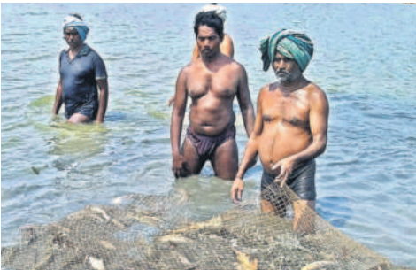
తిరుమలగిరి మండలం వెలిశాల చెరువులో చేపలు పడుతున్న మత్స్యకారులు (ఫైల్)