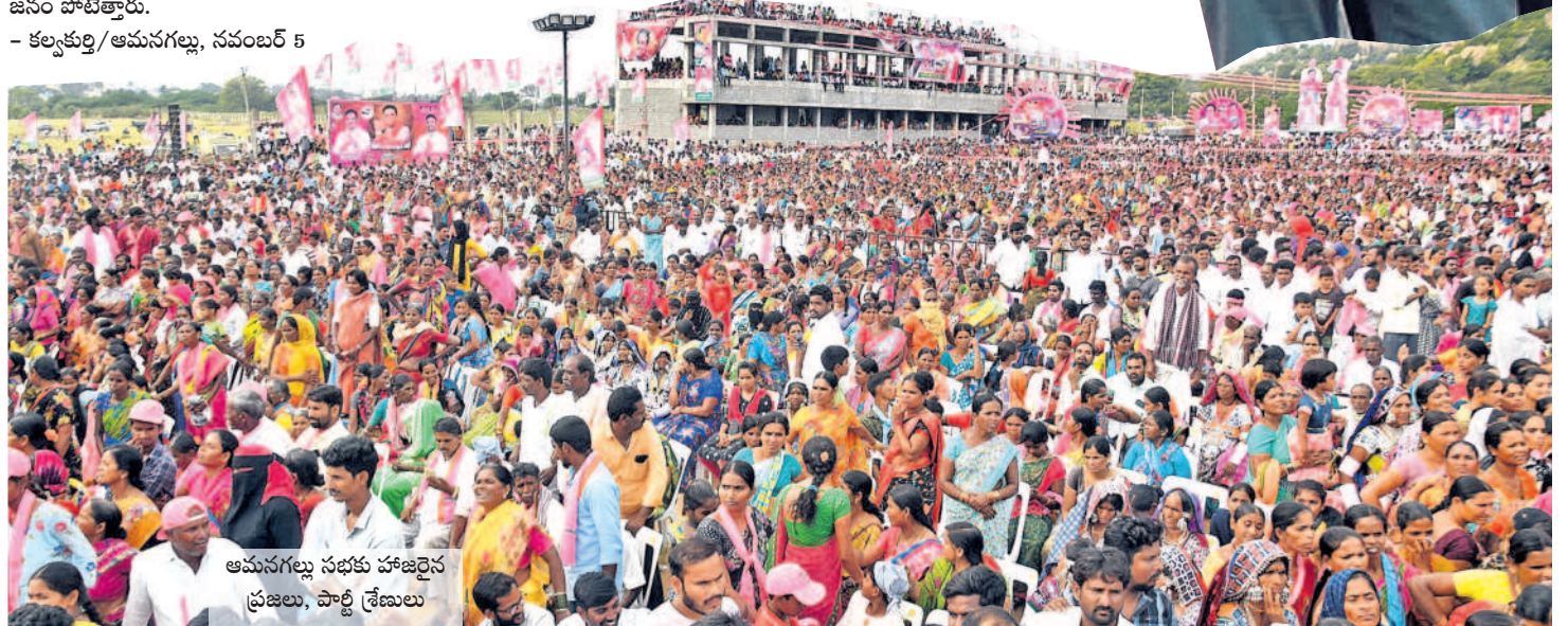
ఆమనగల్లు సభకు హాజరైన ప్రజలు, పార్టీ శ్రేణులు