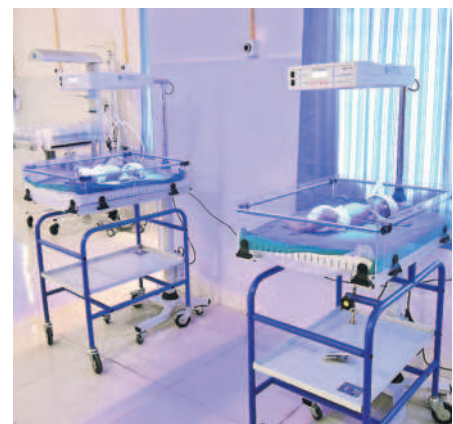
నవజాత శిశు సంరక్షణ కేంద్రం