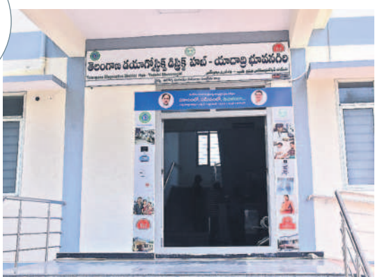
భువనగిరి జిల్లా ప్రభుత్వ దవాఖానలో ఏర్పాటు చేసిన డయాగ్నోస్టిక్ హబ్ భవనం