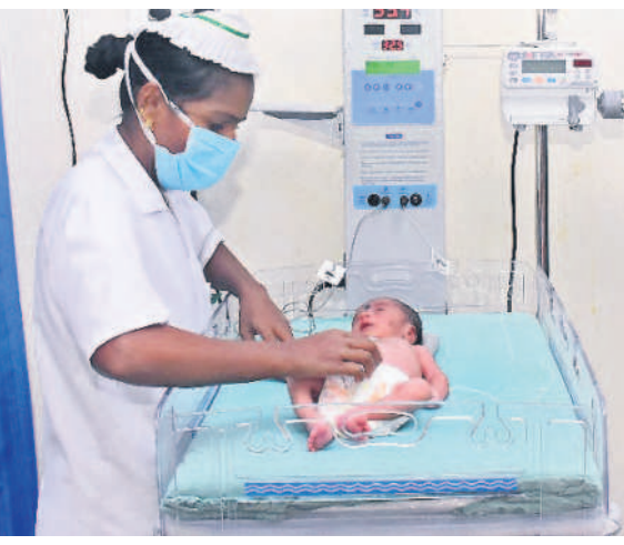
నవజాత శిశు సంరక్షణ కేంద్రంలో బిచ్చాలని పరీక్షిస్తున్న సిబ్బంది

డయాలసిస్ సెంటర్ తో కిడ్నీ బాధితులకు భరోసా 60 సంవత్సరాల నుంచి ఈ ప్రాంత ప్రజలు ఫ్లోరైడ్ నీటిని తాగడంతో 60 ఏండ్లు పైబడిన వారు ఎక్కువగా కిడ్నీ వ్యాధులతో బాధపడుతున్నారు. వారంతా వారంలో కనీసం మూడు సార్లు డయాలసిస్ చేయించుకోవాల్సిన పరిస్థితి. డయాలసిస్ కోసం హైదరాబాద్ కు వెళ్లాలంటే రూ.7వేల నుంచి రూ.10వేల వరకు ఖర్చు అవుతున్నది. దీంతో పేదలు ఆర్థికంగా తీవ్ర ఇబ్బందులు పడేది. కొంతమంది చికిత్స చేయించుకోలేక ప్రాణాలు కోల్పోయిన పరిస్థితి. ఈ క్రమంలో సీఎం కేసీఆర్ రాష్ట్ర వ్యాప్తంగా ఉచిత డయాలసిస్ సెంటర్లు ఏర్పాటు చేశారు. ఇందులో భాగంగా భువనగిరి ఏరియా దవాఖానలో 2023 ఫిబ్రవరి 13న డయాలసిస్ సెంటర్ ఏర్పాటు చేసి అధునాతన పరికరాలు, సిబ్బందిని నియమించారు. ఇందులో నిత్యం 5 సెషన్లలో డయాలసిస్ చేస్తున్నారు. ఇప్పటి వరకు సుమారు 1600లకు పైగా కిడ్నీ బాధితులు డయాలసిస్ చేయించుకున్నారు. అదేవిధంగా జిల్లాలోని ఆలేరు, భువనగిరి, చౌటుప్పల్ సెంటర్లలో ప్రతి రోజూ డయాలసిస్ సేవలు అందిస్తున్నారు.