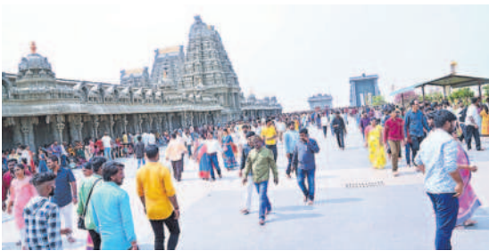
యాదగిరిగుట్ట ఆలయ మాధ వీధుల్లో భక్తులు

యాదగిరిగుట్ట, నవంబర్ 5 : యాదగిరిగుట్ట లక్ష్మీనరసింహ స్వామి క్షేత్రంలో భక్తుల సందడి నెలకొన్నది. ఆదివారం సెలవు కావడంతో స్వామివారి దర్శించుకునేందుకు భక్తులు పెద్ద సంఖ్యలో వచ్చారు. ఆలయ ప్రాంగణంలో ఎటుచూసినా భక్తులే కనిపించారు. స్వామివారి దర్శనార్థం నానికి 3 గంటలు, ప్రత్యేక దర్శనానికి 2 గంటల సమయం పట్టిందని భక్తులు వెల్లడించారు. స్వామి, అమ్మవార్లకు నిత్యార్థాధనలు శాస్త్రోక్తంగా జరిగాయి. తెల్లవారుజామునే ఆలయాన్ని తెరిచిన అర్చకులు సుప్రభాతంతో స్వామివారిని మేల్కొలిపారు. అనంతరం తిరువారాధన జరిపి ఉదయం ఆరగింపు చేపట్టారు. ప్రధానాలయంలో స్వామి, అమ్మవార్లకు నిజాభిషేకం జరిపారు. నిజరూప దర్శనంలో నారసింహులు భక్తులకు దర్శనమిచ్చారు. స్వామివారికి తులసీ సహస్రనామార్చన, అమ్మవారికి కుంకుమార్చన, ఆంజనేయస్వామికి సహస్రనామార్చన చేపట్టి భక్తులకు స్వామి, అమ్మవార్ల దర్శనశాగ్ధ్యం కల్పించారు. ప్రధానాలయ ముఖమండపంలో శ్రీవారికి ఉదయం నుంచి సాయంత్రం వరకు పలు దపాలుగా భక్తులకు సువర్ణపుష్పార్చన జరిపించారు. ఉత్సవమూర్తులను దివ్య మనోహరంగా అలంకరించి కల్యాణోత్సవ సేవ జరిపారు. అనంతరం కల్యాణ మండపంలో స్వామి, అమ్మవార్లను వెంచేపు చేసి కల్యాణతంతు చేపట్టారు.