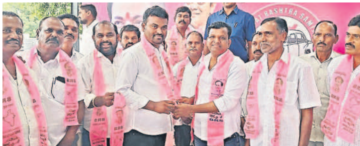
అడ్డగూడూరు : గులాబీ కండువా కప్పి బీఆర్ఎస్లోకి ఆహ్వానిస్తున్న ఎమ్మెల్యే గాదరి కిశోర్కుమార్

• తుంగతుర్తి ఎమ్మెల్యే గాదరి కిశోర్కుమార్