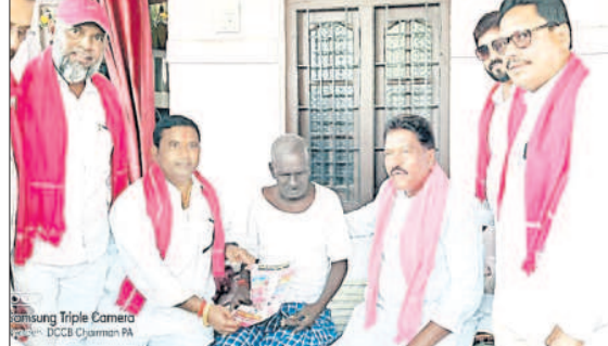
ఎదులాపురం : కారు గుర్తుకు ఓటు వేయాలని అభ్యర్థిస్తున్న డీసీసీబీ చైర్మన్