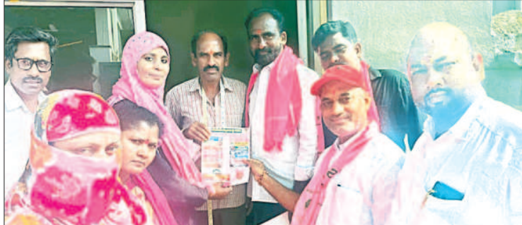
ఆదిలాబాద్ రూరల్ : భుక్తాపూర్లో ఓటు అభ్యర్థిస్తున్న బీఆర్ఎస్ నాయకులు