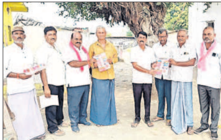
జైనద్ : ఆకుల్లో మ్యూనిసిపాలిటీ గురించి వివరిస్తున్న బీఆర్ఎస్ నాయకులు

ఆదిలాబాద్ రూరల్, నవంబర్ 6 : జిల్లా కేంద్రంలోని 49వ వార్డు భుక్తాపూర్ కాలనీలో బీఆర్ఎస్ నాయకులు ఇంటింటి ప్రచారం నిర్వహించారు. ప్రతి ఒక్కరికీ బీఆర్ఎస్ ప్రభుత్వం ప్రవేశపెట్టిన సంక్షేమ పథకాలు, మ్యూనిసిపాలిటీ గురించి వివరించారు. కారు గుర్తుకు ఓటు వేసి ఆదిలాబాద్