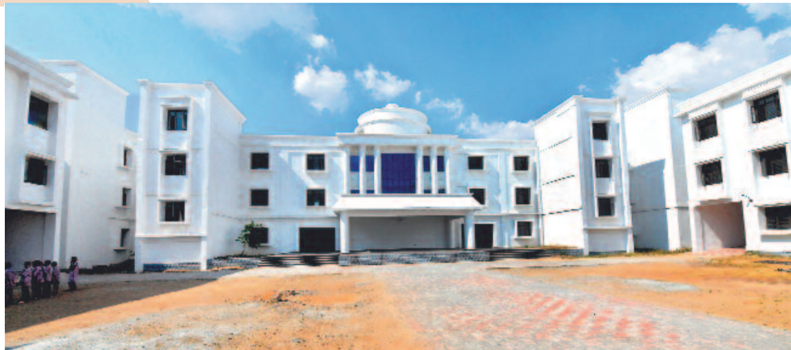
తెలంగాణ రాష్ట్రం ఏర్పడి కేసీఆర్ ముఖ్యమంత్రి అయ్యాక సర్కారు బడుల్లో నాణ్యమైన చదువును అందించాలని నంకల్పించారు. అందులో భాగంగానే, తాము చదువుతున్న దుబ్బాక బడిని కార్పొరేట్ పాఠశాల భవనాన్ని తలదన్నేలా నిర్మించజేశారు. డిజిటల్ క్లాస్ రూమ్లు, విశాలమైన గదులు, కాస్ట్ డిజైన్ హాళ్లు, ల్యాబ్ల నమాహారంగా ఉన్న దీనినినే జూనియర్ కాలేజీ కూడా నడుస్తున్నది. సుమారు రూ.10 కోట్లతో కట్టిన పాఠశాల భవనాన్ని చూస్తే అక్కర్లేపోవాలిదే!