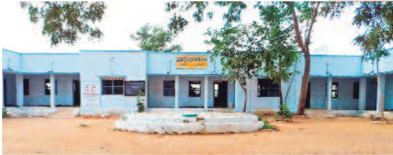
బడి గుడి అంటూ ఈ రెంటిని జంట పదాలుగా చెబుతారు. అలా ఎంతో ఉన్నతంగా జనం భావించే విద్యా వ్యవస్థనూ పూర్వ ప్రభుత్వాలు పెట్టగా పట్టించుకున్నది లేదు. శిథిలావస్థలో బడి భవనాలు, అరకొర వసతులు, అంతంత మాత్రపు చదువులతో నర్సారీ బడిలో ఇంతకన్నా ఎక్కువ ఆశించలేం అన్నట్టుగా ఉండేది నాటి పరిస్థితి. ఇక్కడ సాదాసీదాగా కనిపిస్తున్నది నిర్దిష్ట జిల్లా దుబ్బాకలోని అలాంటి ఒక ప్రభుత్వ పాఠశాల భవనమే.