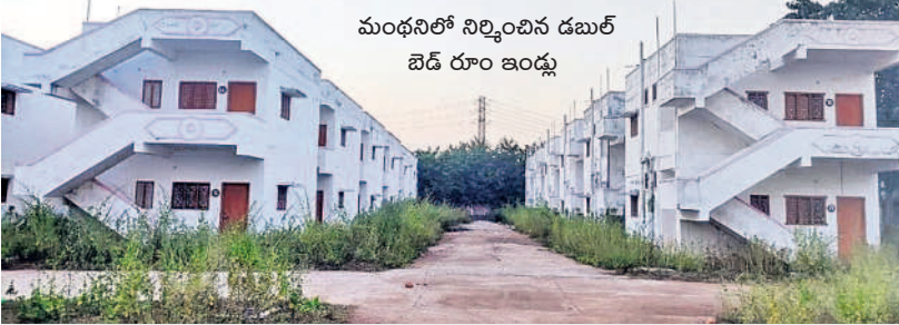
మంధనిలో నిర్మించిన డబుల్ బెడ్ రూం ఇండ్లు