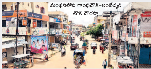
మంధనిలోని గాంధీచౌక్-అంబేద్కర్ చౌక్ చొరసా