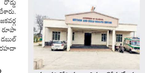
మంధనిలోని మాతా శిశు ఆరోగ్య కేంద్రం

ప్రభుత్వం, జడ్చీ చైర్మన్ పుట్ట మధూకర్ ప్రత్యేక చొరవతో రూ.10 కోట్ల నిధులతో మంధనిలో ఏర్పాటు చేసిన ప్రభుత్వ మాతా శిశు ఆరోగ్య కేంద్రం(ఎన్సీహెచ్) గర్భిణులు, బాలింతలు, శిశువుల పాలిట వరంగా మారింది. గర్భ నిర్ధారణ నుంచి మొదలై పుట్టిన బిడ్డకు ఐదేండ్లు వచ్చే వరకు రూపాయి ఖర్చు లేకుండా అన్ని రకాల వ్యాధులకు ఉచితంగా వైద్య సేవలు అందించడంతో పాటు అత్యాధునిక పరికరాలతో వైద్య సేవలు అందిస్తున్నారు.