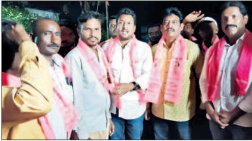
రామగిరి : బీఆర్ఎస్లో చేరుతున్న బెంగంపేట యువకులు