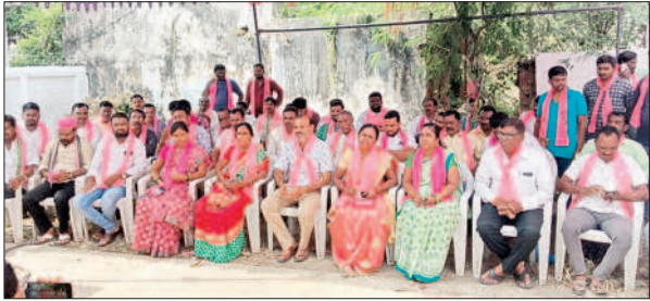
కమాన్ పూర్ : మాట్లాడుతున్న బీఆర్ఎస్ నాయకులు