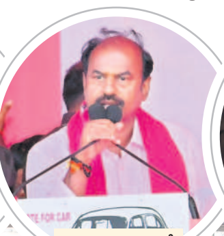
మాట్లాడుతున్న ఎమ్మెల్యే బండ్ల కృష్ణమోహన్ రెడ్డి