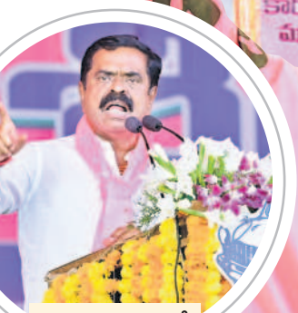
మాట్లాడుతున్న ఎమ్మెల్యే చిట్టం రామ్మోహన్ రెడ్డి