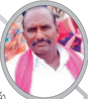
- నల్గొండ, రైతు, పుసాల్ పాట్, మరికల్ మండలం, నారాయణపేట జిల్లా

కాంగ్రెస్ అధికారంలోకి వస్తే మళ్ళీ దళారుల పాలన వస్తుంది. దళారులను నమ్మి గతంలో మోసం పోయినం. మళ్ళీ మాకు ఆ రోజులు వద్దు. మాకు మంచి పాలన చేస్తున్న కేసీఆర్ సారే కావాలి. కాంగ్రెస్ చెప్పే మాటలు రైతులు ఎవరూ వినరు. గతంలో పాలించిన కాంగ్రెస్ తో రైతులు విసిగిపోయారు. బీఆర్ఎస్ ప్రభుత్వం పైనే రైతులకు భరోసా కలిగింది.