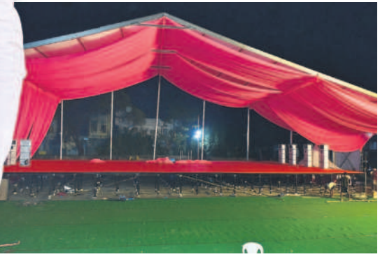
పెద్దపల్లిలో సిద్ధమవుతున్న సభా వేదిక