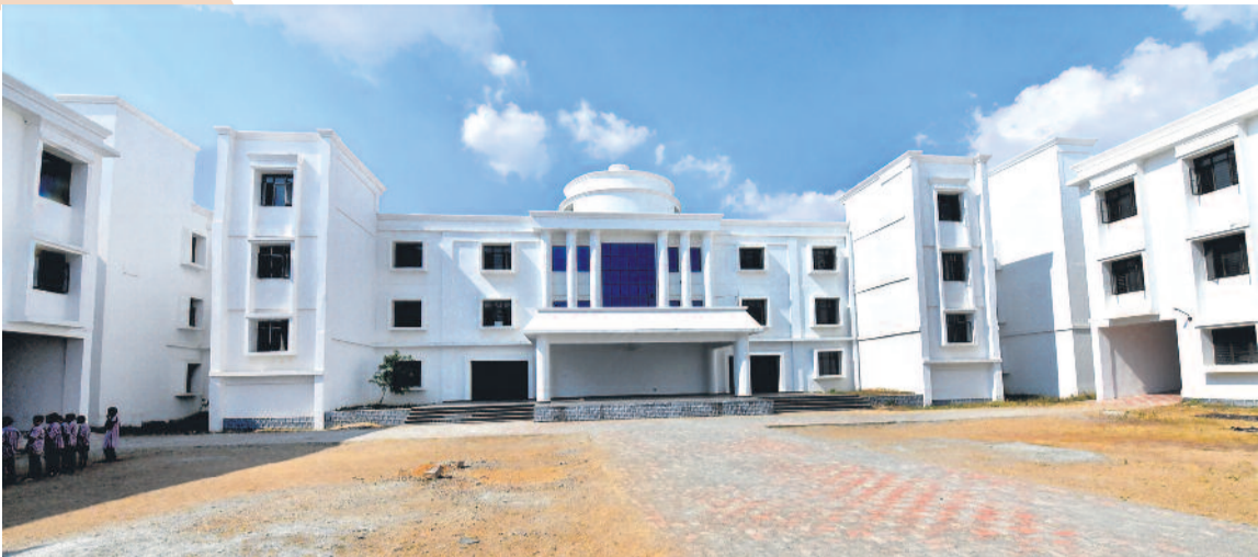
తెలంగాణ రాష్ట్రం ఏర్పడి కేసీఆర్ ముఖ్యమంత్రి అయ్యాక సర్కారు బడుల్లో నాణ్యమైన చదువును అందించాలని నంకల్పించారు. అందులో భాగంగానే, తాము చదువుకున్న దుబ్బాక బడిని కార్పొరేట్ పాఠశాల భవనాన్ని తలదన్నేలా నిర్మించజేశారు. డిజిటల్ క్లాస్ రూమ్లు, విశాలమైన గదులు, కాస్ట్ డిజైన్ హాళ్లు, ల్యాబ్ల నూనూరంగా ఉన్న దీనిలోనే జూనియర్ కాలేజీ కూడా నడుస్తున్నది. సుమారు రూ.10 కోట్లతో కట్టిన పాఠశాల భవనాన్ని చూస్తే అక్కర్లేపోవచ్చుండే!