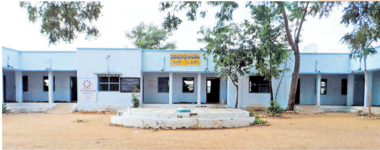
బడి గుడి అంటూ ఈ రెంటిని జంట పదాలుగా చెబుతారు. అలా ఎంతో ఉన్నతంగా జనం భావించే విద్యా వ్యవస్థనూ పూర్వ ప్రభుత్వాలు పెట్టగా పట్టించుకున్నది లేదు. శిథిలావస్థలో బడి భవనాలు, అరకొర వనతులు, అంతంత మాత్రపు చదువులతో నర్సూరు బడిలో ఇంతకన్నా ఎక్కువ ఆశించలేం అన్నట్టుగా ఉండేది నాటి పరిస్థితి. ఇక్కడ సాదాసీదాగా కనిపిస్తున్నది నిర్దిష్ట జిల్లా దుబ్బాకలోని అలాంటి ఒక ప్రభుత్వ పాఠశాల భవనమే.