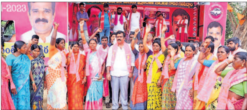
అందోల్: కొడెకల్ లో క్రాంతికిరణ్ కు మద్దతుగా ప్రచారంలో పాల్గొన్న మహిళలు