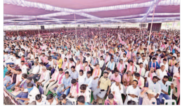
సీఎం హామీతో జేజేలు పలుకుతున్న మక్తల్ ప్రజా ఆశీర్వాద సభ హాజరైన ప్రజలు