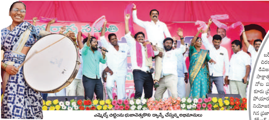
ఎమ్మెల్యే చిట్టెంసుభుజానెత్తుకొని డ్యాన్స్ చేస్తున్న అభిమానులు