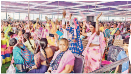
సీఎం సభలో చిట్టెం రామన్న సాంగ్ కు డ్యాన్స్ చేస్తున్న మహిళలు