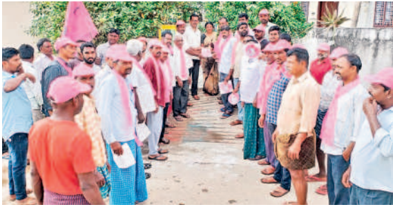
కరపత్రాలు అందిస్తూ ఎన్నికల ప్రచారం చేస్తున్న బీఆర్ఎస్ నాయకులు