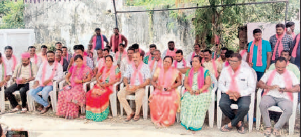
కమాన్ పూర్ : మాట్లాడుతున్న బీఆర్ఎస్ నాయకులు