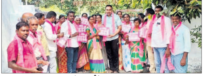
ప్రచారం చేస్తున్న నాయకులు