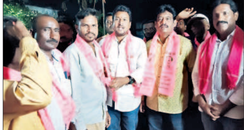
రామగిరి : బీఆర్ఎస్లో చేరుతున్న బెంగంపేట యువకులు