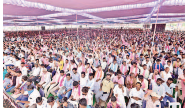
సీఎం హామీతో జేజేలు పలుకుతున్న మక్తల్ ప్రజా ఆశీర్వాద సభ హాజరైన ప్రజలు