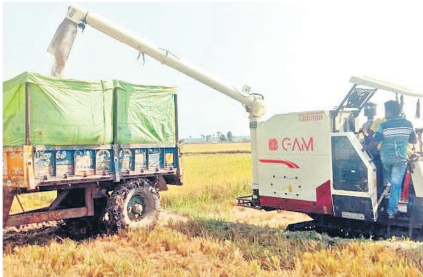
మిర్యాలగూడ మండలం యాధార్ పల్లిలో పాలం కోసీ ట్రాక్టర్లో వడ్లు పోస్తున్న హార్వెస్టర్

మరోవైపు కుడి కాల్యకు నీళ్లు వదులుకొని ఆంధ్రా రైతుల పంటలను కాపాడారు. కానీ.. స్వరాష్ట్రంలో బీఆర్ఎస్ ప్రభుత్వం తెలంగాణ రైతుల పక్షాన నిలిచి అవసరమైనప్పుడల్లా నీటిని అందిస్తూ పంటలను కాపాడుతున్నది. ఈ క్రమంలో ఇటీవల సాగర్ డెడ్ స్టోరేజీలో ఉన్నా.. చివరి దశలో ఉన్న పంటలను కాపాడేందుకు సీఎం కేసీఆర్ ఎడమ కాల్యకు నీటిని వదిలి వరి పైరుకు జీవం పోశారు. దీంతో అధిక దిగుబడి సాధించడంతోపాటు మార్కెట్లో మద్దతుకు మించి ధర పలుకడంతో అన్నదాతలు సంతోషం వ్యక్తం చేస్తున్నారు.