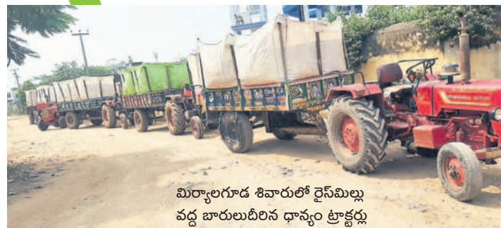
మిర్యాలగూడ శివారులో రైస్ మిల్లు వద్ద బారులుదీరిన ధాన్యం ట్రాక్టర్లు