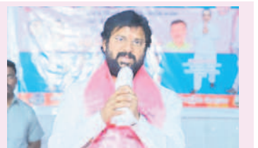
మాట్లాడుతున్న బీఆర్ఎస్ అభ్యర్థి, ఎమ్మెల్యే కోరుకంటి పన్ను మాఫీ ఘనత