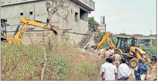
పోచారంలో అక్రమ నిర్మాణాలను కూల్చివేస్తున్న అధికార బృందం