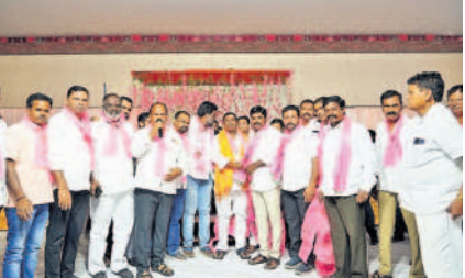
రామచంద్రాపురం : పార్టీలో చేరుతున్న వారికి గులాబీ కండువా కమ్మి ఆహ్వానిస్తున్న ఎమ్మెల్యే గూడెం