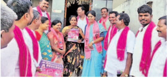
గుమ్మడిదల : వీరస్వగూడెంలో కారుగుర్తుకు ఓటిసే అభివృద్ధికి సహకరించాలని కోరుతున్న బీఆర్ఎస్ నాయకులు