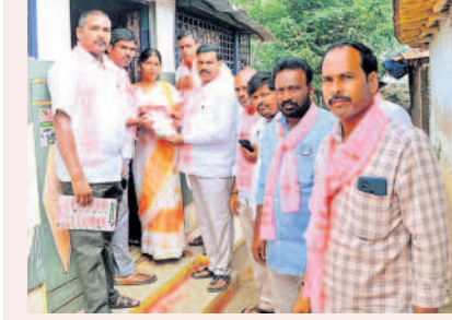
మిరుదొడ్డి: మోతలో ప్రచారం చేస్తున్న గులాబీ నేతలు