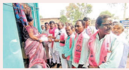
మిరుదొడ్డి: ఓటు అభ్యర్థిస్తున్న బీఆర్ఎస్ నాయకులు