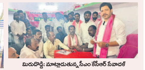
మిరుదొడ్డి: మాట్లాడుతున్న సీఎం కేసీఆర్ సేనాధిపతి