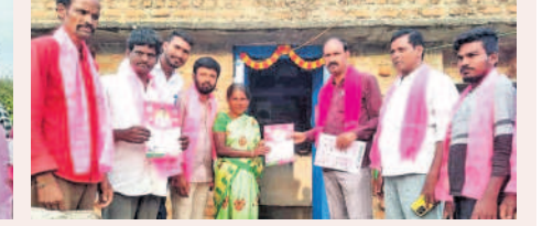
రాయపాల్: చెట్ల నర్సంపల్లిలో ప్రచారం చేస్తున్న నేతలు