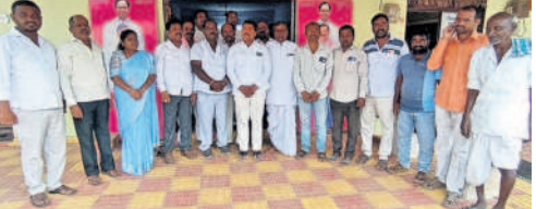
మాట్లాడుతున్న ప్రజాప్రతినిధులు, బీఆర్ఎస్ నాయకులు