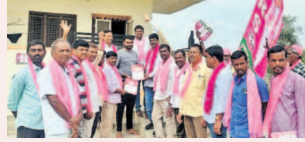
రాయపాల్: తిమ్మ కృష్ణలల్లి మ్యూనిసిపాలిటీలో ప్రచారం