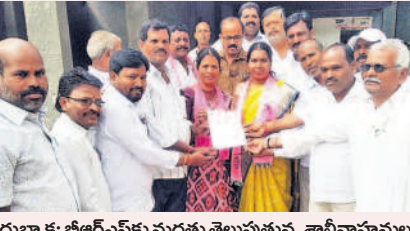
దుబ్బాక: బీఆర్ఎస్ కు మద్దతు తెలుపుతున్న శాలీవాహనులు