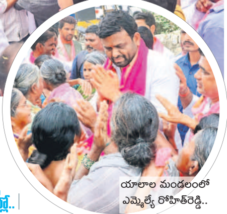
యాలాల మండలంలో ఎమ్మెల్యే రోహిత్ రెడ్డి..