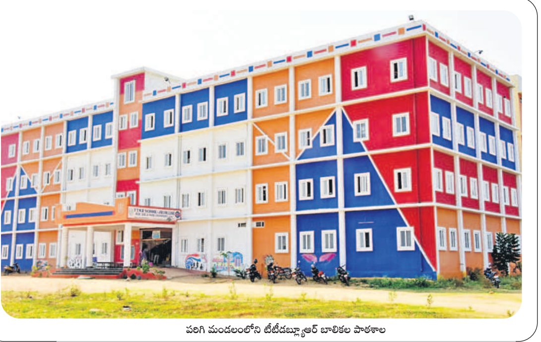
పరిగి మండలంలోని టీటీడబ్ల్యూఆర్ బాలికల పాఠశాల