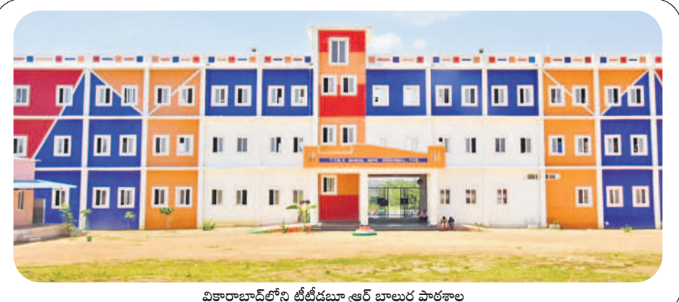
వికారాబాద్లోని టీటీడబ్ల్యూఆర్ బాలరు పాఠశాల