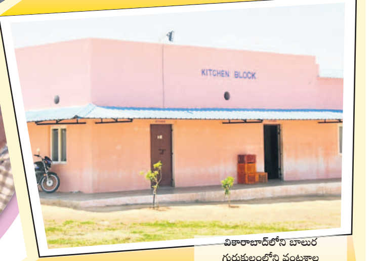
వికారాబాద్లోని బాలరు గురుకులంలోని వంటశాల