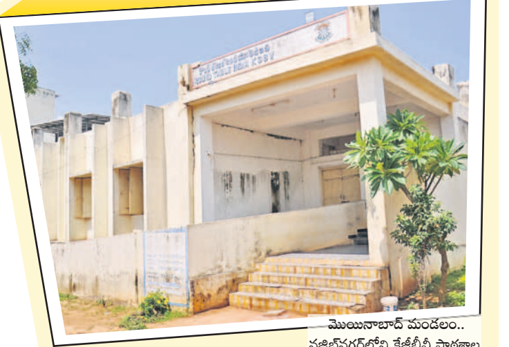
మొయినాబాద్ మండలం.. నజీఫ్ గర్లోని కేజీపీ పాఠశాల