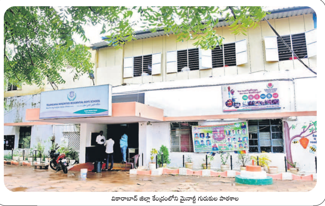
వికారాబాద్ జిల్లా కేంద్రంలోని మైనాథ్ గురుకుల పాఠశాల