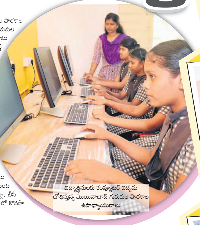
విద్యార్థులకు కంప్యూటర్ విద్యను బోధిస్తున్న మొయినాబాద్ గురుకుల పాఠశాల ఉపాధ్యాయురాలు