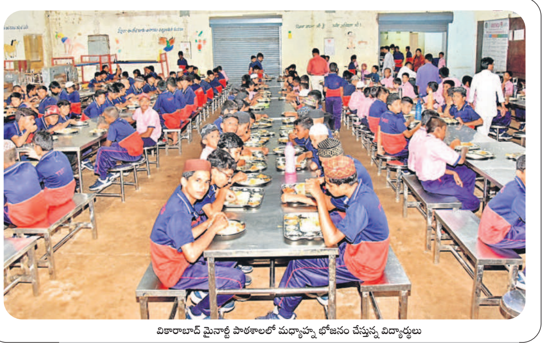
వికారాబాద్ మైనాథ్ పాఠశాలలో మధ్యాహ్న భోజనం చేస్తున్న విద్యార్థులు