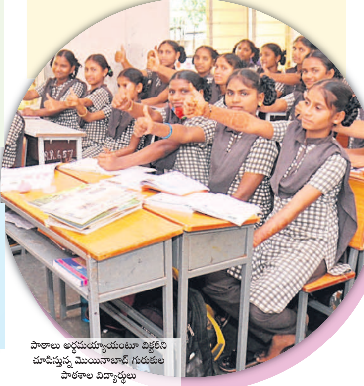
పాఠాలు అర్థమయ్యాయంటూ వికృతినీ చూపిస్తున్న మొయినాబాద్ గురుకుల పాఠశాల విద్యార్థులు

చదువులో రాణిస్తున్న గురుకులాల విద్యార్థులు