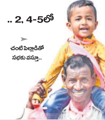
.. 2, 4-5లో చంటిపిల్లడితో సభకు వస్తూ..