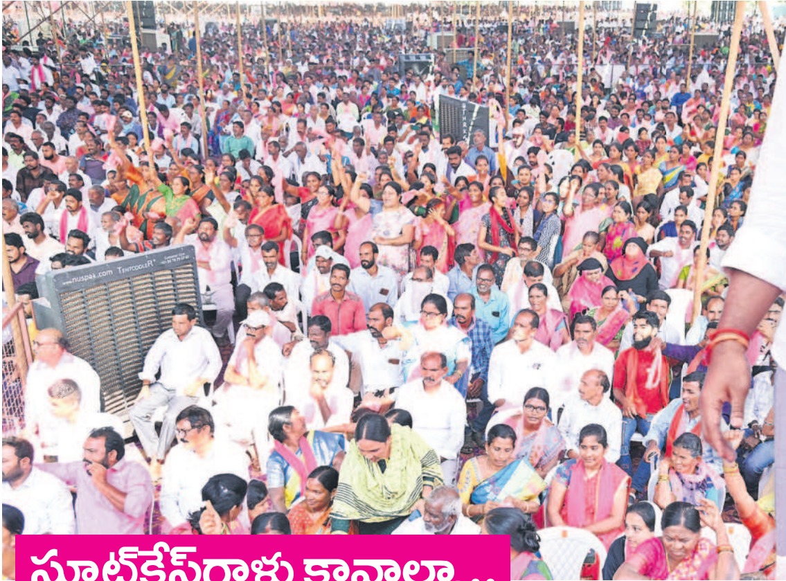
సూట్ కేసు గాళ్లు కావాలన్నా..

సభా వేదికపై నమస్కరిస్తున్న సీఎం కేసీఆర్. పక్కన సుమన్