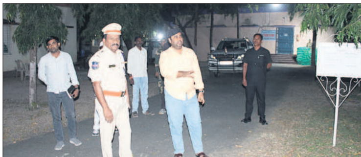
స్టాంక్ రూంలను పరిశీలిస్తున్న కలెక్టర్, ఎస్పీ