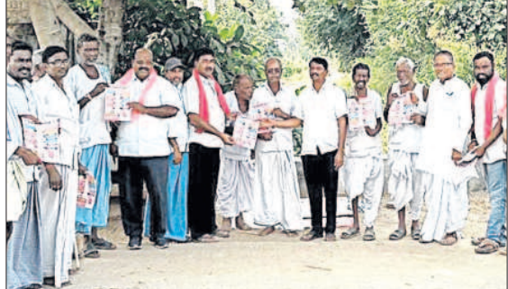
జైనధ్ : లేకర్వాడలో ప్రచారంలో పాల్గొన్న బీఆర్ఎస్ నాయకులు