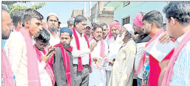
ఎదులాపురం : కారు గుర్తుకు ఓటు వేయాలని అభ్యర్థిస్తున్న డీసీసీబీ చైర్మన్, వైస్ చైర్మన్, నాయకులు