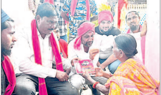
ఎదులాపురం : ప్రచారం చేస్తున్న జిల్లా అధికారి ప్రతినిధి, మున్సిపల్ వైస్ చైర్మన్