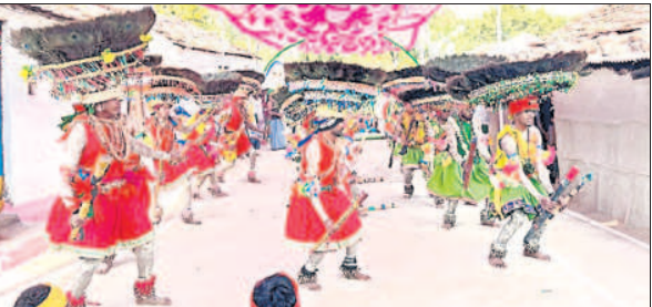
బజార్ హత్వూర్ : దండారీ ఉత్సవం చేస్తున్న గుస్సాడీలు

కొత్తపల్లె, లక్ష్మీపూర్, నక్కలవాడ, పట్టుపూర్, పిప్పల్ ధరి, జడిపల్లి, సాంగ్లి గ్రామాలలో దండారీ ఉత్సవాలు ఘనంగా నిర్వహిస్తున్నారు. ఆయా గూడెల్లో కొండక దేవు