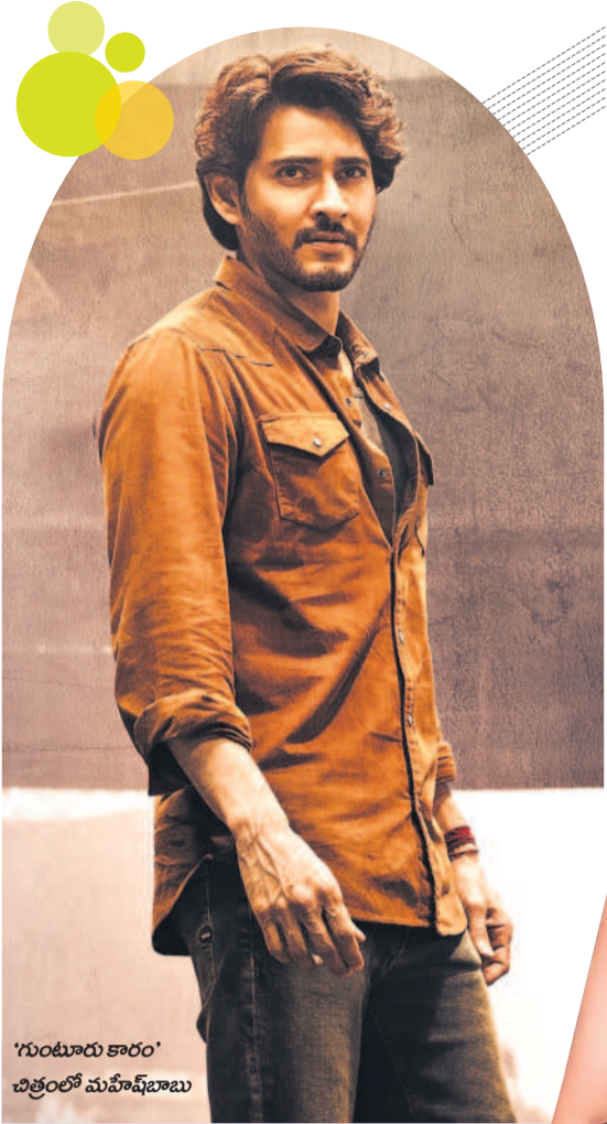
'గుంటూరు కార్' చిత్రంలో మహేశ్ బాబు