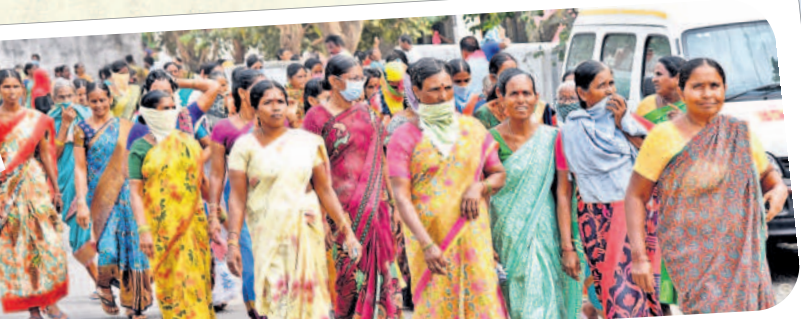
సభకు తరలివస్తున్న మహిళాలోకం..

ఈ జిల్లాలో ఇద్దరు.. ముగ్గురు మోపయ్యారు. ఒకడైతే పకాత్ పేకాట్ క్రబ్బులు పెట్టి పైనలు మందినెత్తికొట్టి సంపాదించాడు. ఆ డబ్బులు తెచ్చి సీసాలు, అదిఇది వంది గోల్ మాల్ చేస్తున్నారు. గోల్ మాల్ గోవిందం గాళ్లను ప్రజలు గోల్ మాల్ చేయనంత వరకు ఇదే దర్జం ఉంటుంది. ఈ దర్జాన్ని వదిలించుకోవాలి. ఆ శక్తి మీ చేతుల్లోనే ఉంటుంది. వారు వచ్చి అడిగితే మొహమాటానికి ఆ అనాల్. సురుకుపెట్టే కాద సురుకు పెట్టాలి.