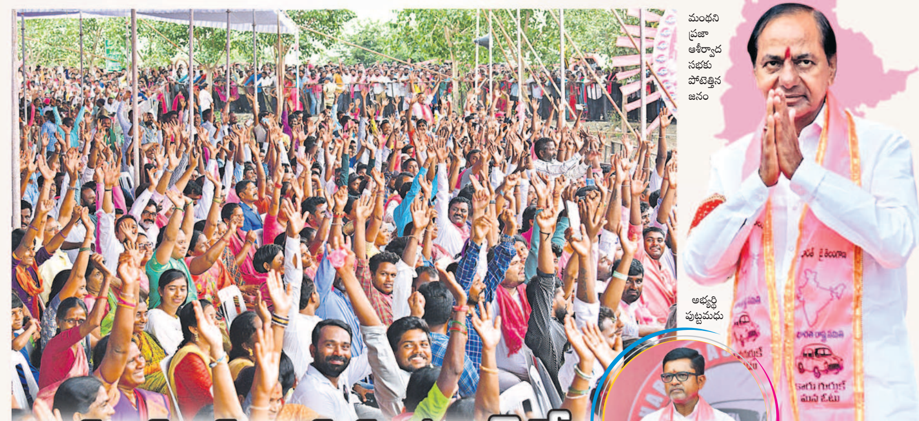
మంధని ప్రజా ఆశీర్వాద సభకు పోటెత్తిన జనం