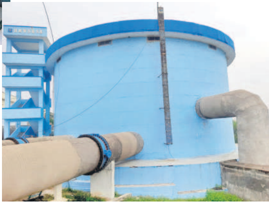
మేడ్చల్ మండలం ఫున్ ఫున్ క్షేత్ర గిరి గుట్టపై నిర్మించిన 150 ఎంఎల్ డి సామర్థ్యం ఉన్న ఎంబీఆర్ (మాస్టర్ బ్యాల్విస్టింగ్ రిజర్వాయర్)

కెళ్లొందుకు ప్రధాన పైపులైన్, అంతర్గత పైపులైన్, సంవ్లు, ఓహెచ్బీఆర్లు, బీపీటీ, ఓహెచ్ఆర్ఎస్ నిర్మాణానికి రూ.279.25 కోట్ల వ్యయం చేశారు. రిజర్వాయర్ నుంచి నీటిని సరఫరా చేసేందుకు మేడ్చల్ పట్టణంలోని టీటీడీ కల్యాణ మండలం వెనుక 1000 కేఎల్ సామర్థ్యంతో రెండు సంవ్లను నిర్మించారు. వీటిలో ఒకటి మున్సిపాలిటీకి కేటాయించగా, మరొకదాన్ని మేడ్చల్, కుత్బుల్లాపూర్ మండలాలకు నీటిని అందించేందుకు కేటాయించారు. ఈ సంవ్ల ద్వారా ఆయా మండలాల్లోని గ్రామాలకు నీటి సరఫరా చేసేందుకు డబ్లిల్ పూర్ లో 40 కేఎల్ సామర్థ్యంతో ఒక ఓహెచ్బీఆర్, 120 కేఎల్ సామర్థ్యంతో గిర్నాపూర్ లో మరో ఓహెచ్బీఆర్ నిర్మించారు. ఫున్ ఫున్ ఎంబీఆర్ నుంచి శామీర్ పేటకు నేరుగా, ఘట్ కేసర్, కీసర్ మండలాలకు నీటిని సరఫరా చేసేందుకు 200 కేఎల్ సామర్థ్యంతో ఒక బీపీటీని కీసర్ మండలం భోగారంలో నిర్మిస్తున్నారు. ఈ ట్యాంకులు, ప్రధాన పైపులైన్ నిర్మాణం, పవ్ హౌజ్, నీటిని తోడే పంపిల ఏర్పాటు కోసం 160 కోట్లు ఖర్చు చేశారు. మేడ్చల్ మున్సిపాలిటీ పరిధిలోని వివిధ కాలనీలు, వార్డులకు నీటి సరఫరా చేసేందుకు అంతర్గత పైపులైన్, వోహెచ్ఆర్ఎస్ నిర్మాణం కోసం రూ.44.50 కోట్లు, మండలంలోని వివిధ గ్రామాల్లో ఓహెచ్ఆర్ఎస్ ట్యాంకులు, పైపులైన్ కు రూ.14.50 కోట్లు, శామీర్ పేట మండలానికి రూ.31.87 కోట్లు, కీసర్ మండలానికి రూ.5.68 కోట్లు, ఘట్ కేసర్ కు రూ.13.13 కోట్లు, కుత్బుల్లాపూర్ మండలానికి రూ.9.57 కోట్లు మొత్తం రూ.119.25 కోట్ల వ్యయం చేశారు. ఇంటింటికీ నీటి సరఫరాలో కోసం అంతకు ముందున్న వోహెచ్ఆర్ఎస్ లను వినియోగించడంతో పాటు కొత్తగా 66 వరకు ఓహెచ్ఎస్ఆర్ (ఓవర్ హెడ్ సర్వీస్ రిజర్వాయర్)లను నిర్మించారు. మేడ్చల్ మున్సిపాలిటీతో పాటు ఐదు మండలాలకు నీటిని అందించేందుకు 256.18 కోట్ల మీటర్ల