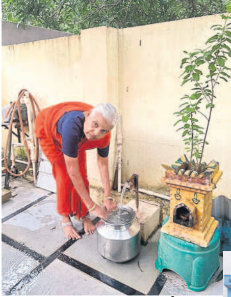
మేడ్చల్ పట్టణంలో తన ఇంట్లోనే మిషన్ భగీరథ నీటిని పట్టుకుంటున్న మహిళ