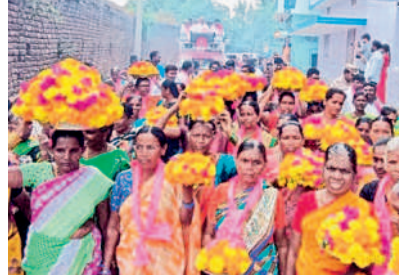
బతుకమ్మలతో కడియంకు స్వాగతం పలుకుతున్న మహిళలు