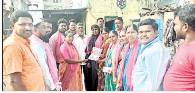
ధర్మపురి: ప్రచారం నిర్వహిస్తున్న బీఆర్ఎస్ నాయకులు