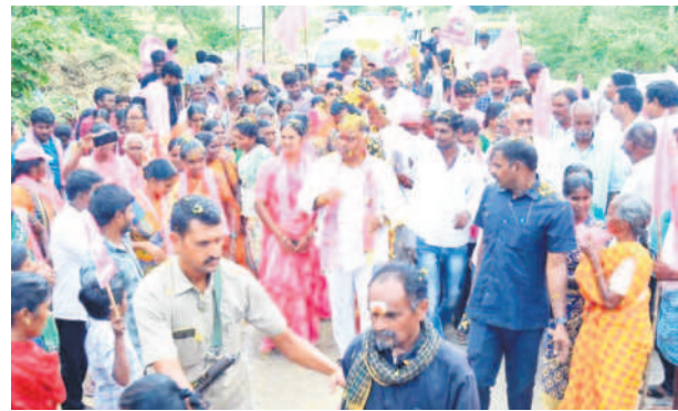
నేలకొండపల్లి మండలంలో కందాళ ప్రచారం