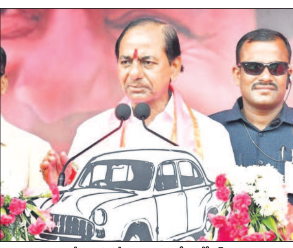
ప్రజా ఆశీర్వాద సభలో మాట్లాడుతున్న సీఎం కేసీఆర్